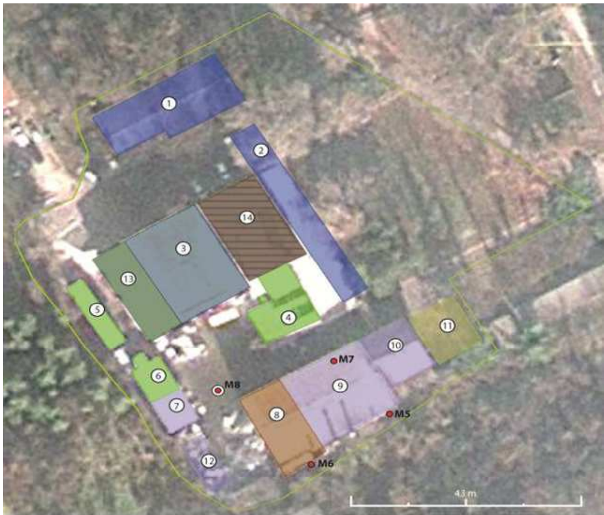
Слика бр.6 Мерни места на емисии во канализација MM7 и MM8