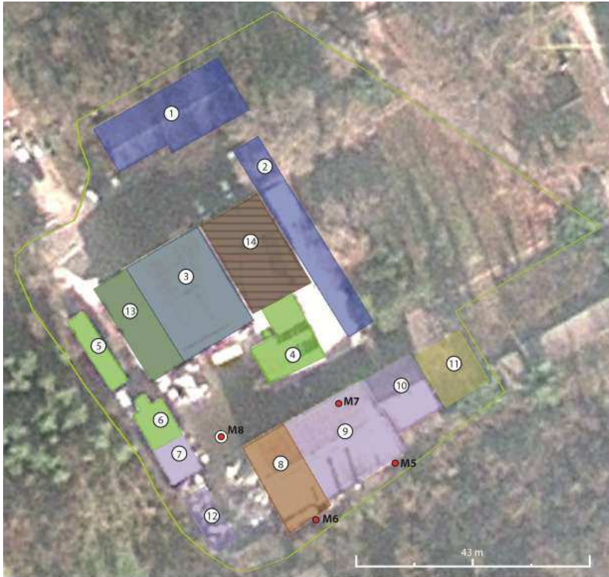
РЖ ИНСТИТУТ - А.Д, Скопје