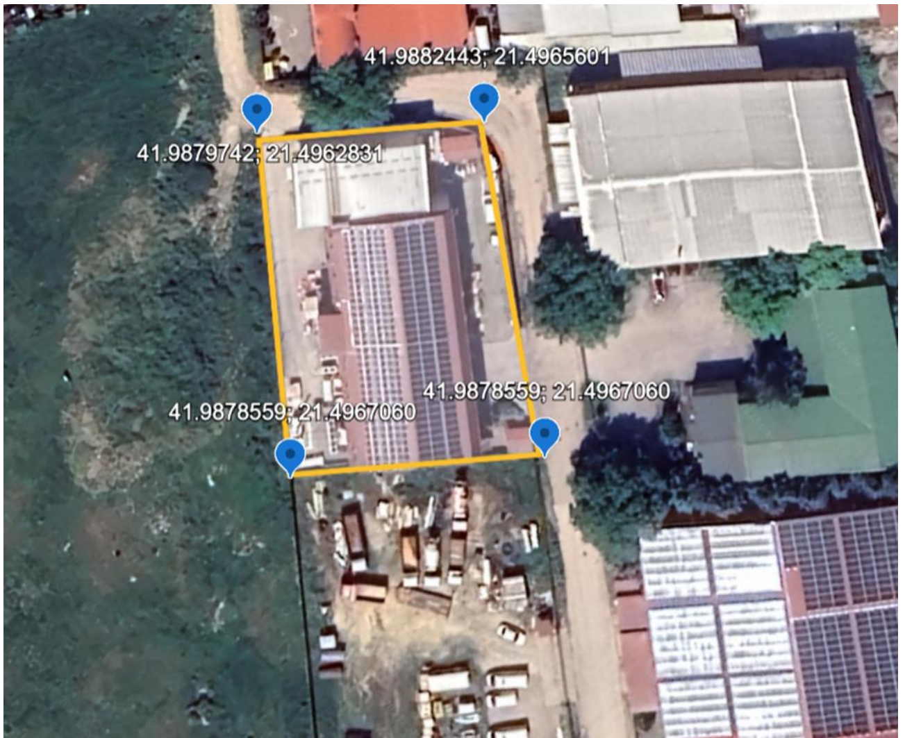
Координати на точки на граница на инсталацијата РИМЕС МС ГРОУП

Дополнување направено во дел II – Опис на техничките активности согласно укажувањата на заклучокот