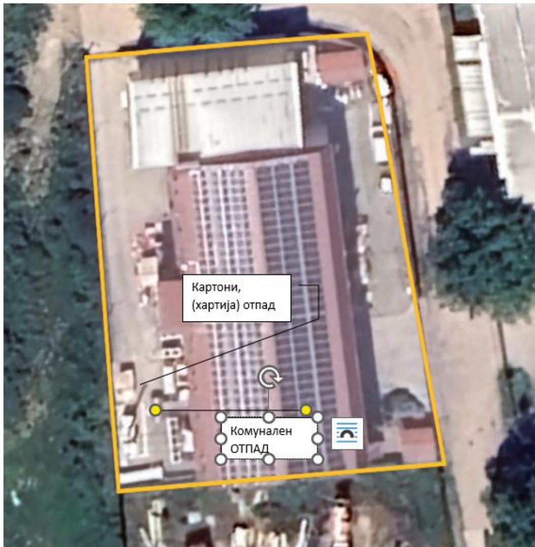
Локации во кругот на инсталацијата каде што се врши одлагање на отпадот