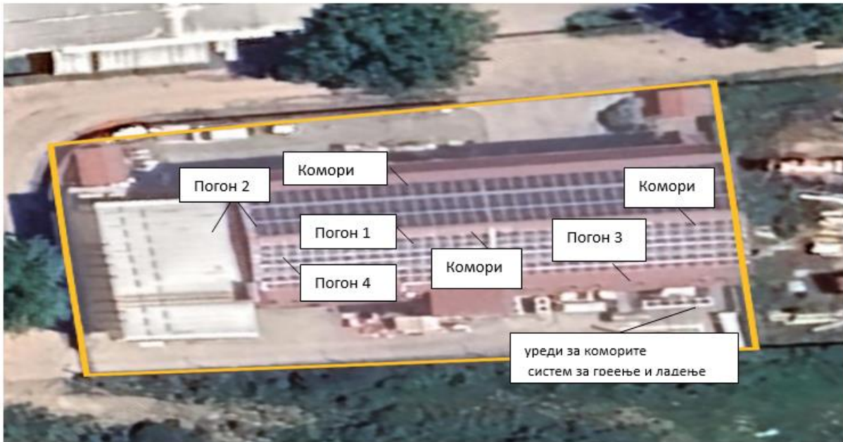
Диспозиција на инфраструктурни објекти на локацијата