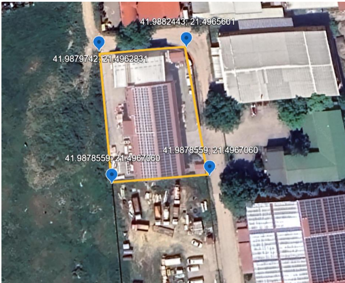
Приказ на точки за мониторинг на емисии на бучава