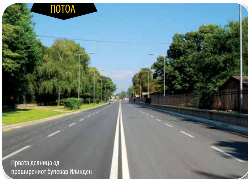
Првата делница од проширениот булевар Илинден

2 000 метри. Од левата и десната страна на булеварот е засадена трева на површина од околу 15 000 квадратни метри и е поставена хидрантска мрежа за полевање. Во средишното зеленило од двете страни на булеварот се засадени 120 дрворедни садници од видот „укасно јаболко“. За комплетното хортикултурно уредување на третиот дел од булеварот Илинден се издвоени околу 6,6 милиони денари. Со тоа, вкупната инвестиција за реконструкција и проширување на третиот дел од булеварот Илинден изнесува околу 80 милиони денари – нагласува градоначалникот Трајановски.