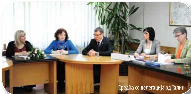
Средба со делегација од Талин