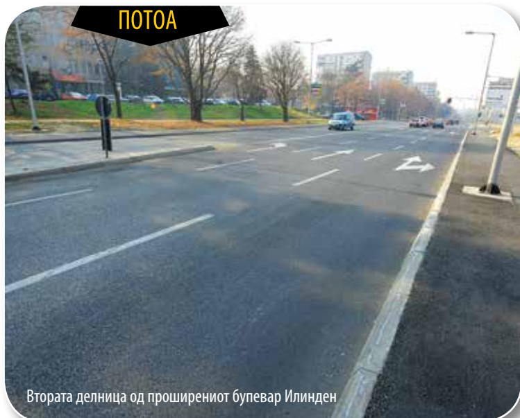
Втората делница од проширениот булевар Илинден