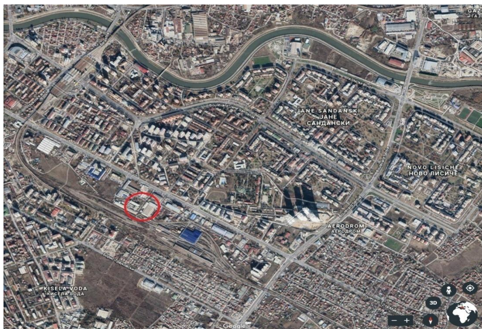
Мапа 1.1.2-б. Макролокациска мапа на локација на инсталација