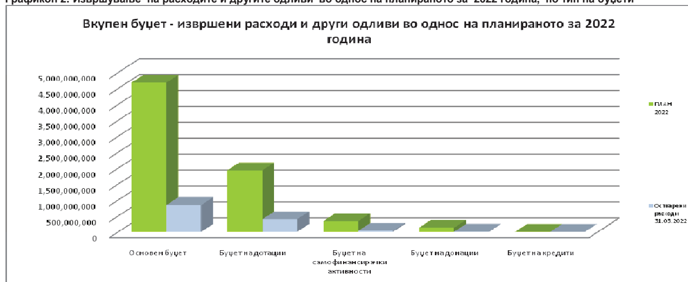
Графикон 2: Извршување на расходите и другите одливи во однос на планираното за 2022 година, по тип на буџети

Во продолжение се прикажани податоците за извршување на буџетот на Град Скопје за периодот 01.01 – 31.03.2022 година по поединечни буџети од кои е составен (основен буџет, буџет на дотации, буџет на самофинансирачки активности, буџет на донации и буџет на кредити).