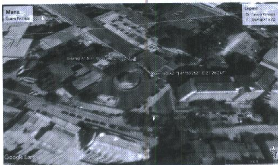
Мерни места на стационарни извори на емисии во воздух