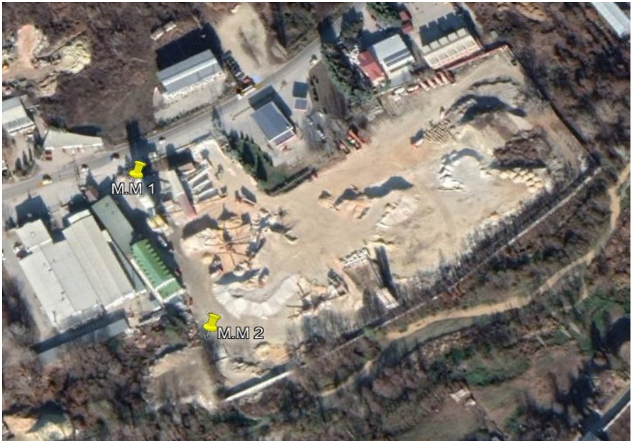
Мапа на Точки на емисии во амбиентниот воздух (MM1 N:41.93146 E:21.49571 и MM2 N:41.93059 E:21.49633)