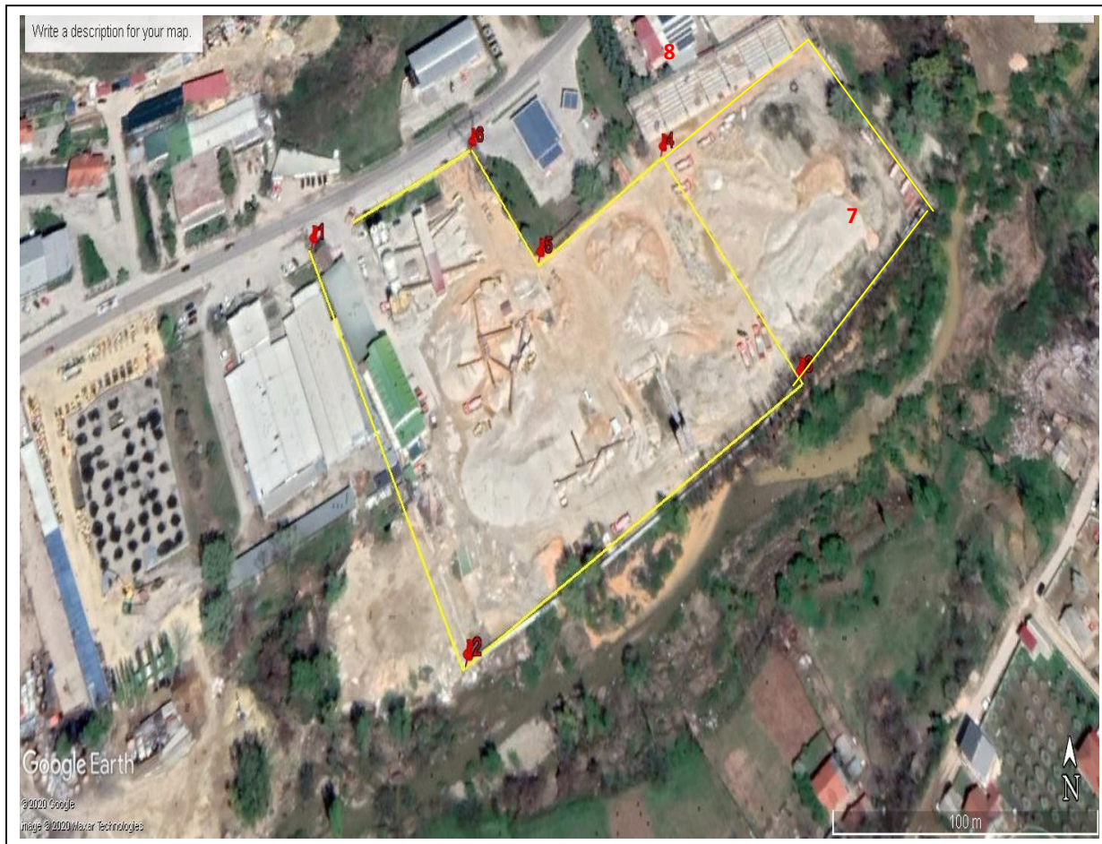
Мапа на граници на инсталацијата