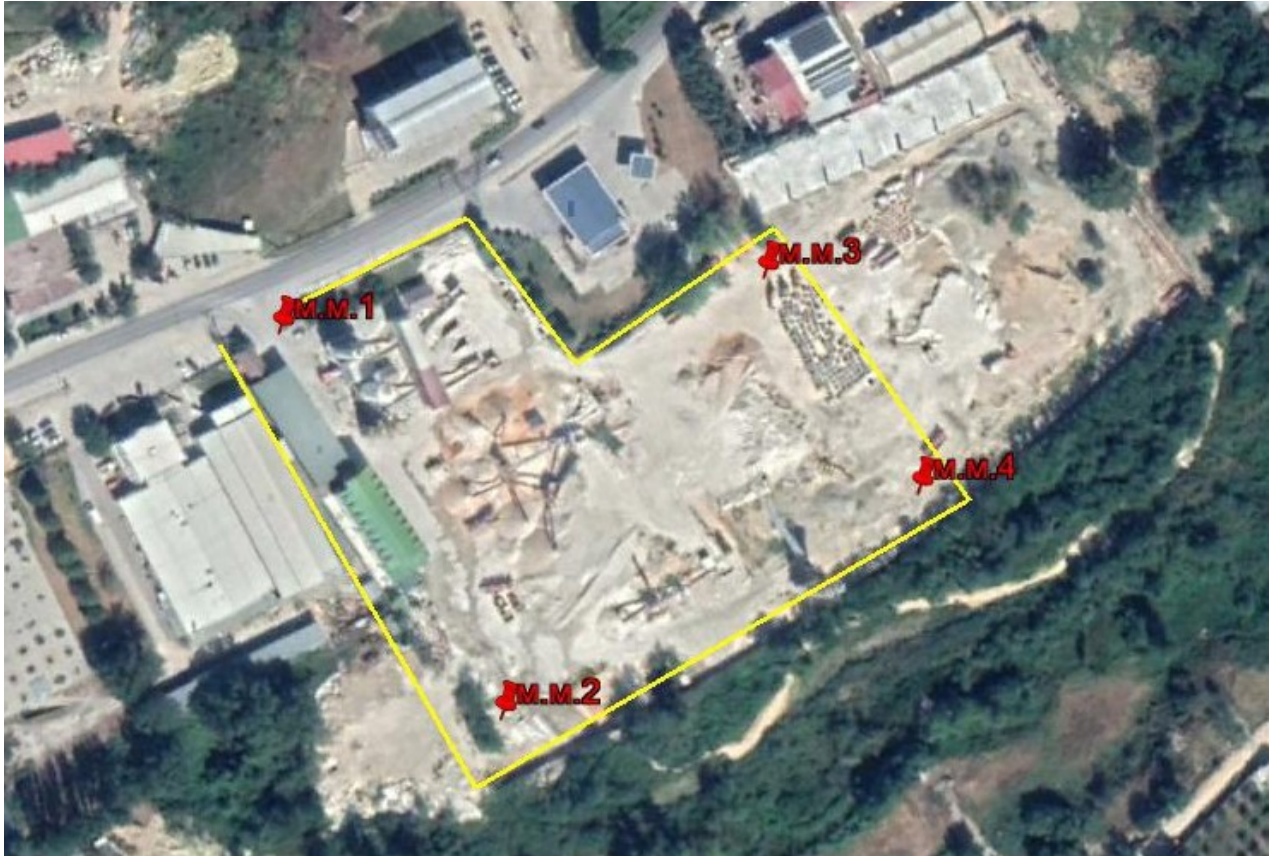
Мапа на Мерни места на бучава на границите на локацијата