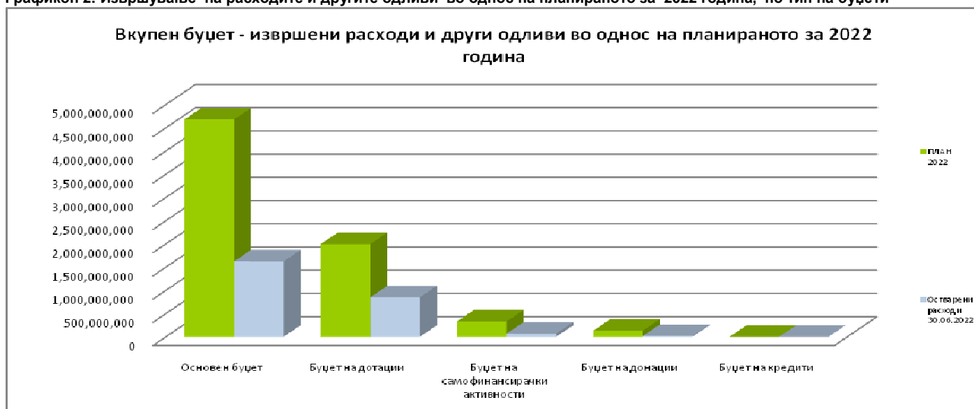
Графикон 2: Извршување на расходите и другите одливи во однос на планираното за 2022 година, по тип на буџети

Подолу прикажаниот графикон 2, го претставува извршувањето на вкупните расходи и другите одливи за вториот квартал од 2022 година во однос на планот за 2022 година, по тип на буџети.