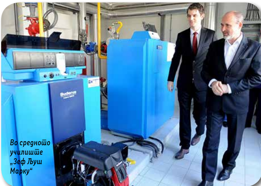
Во средното училиште „Зеф Љуш Марку“