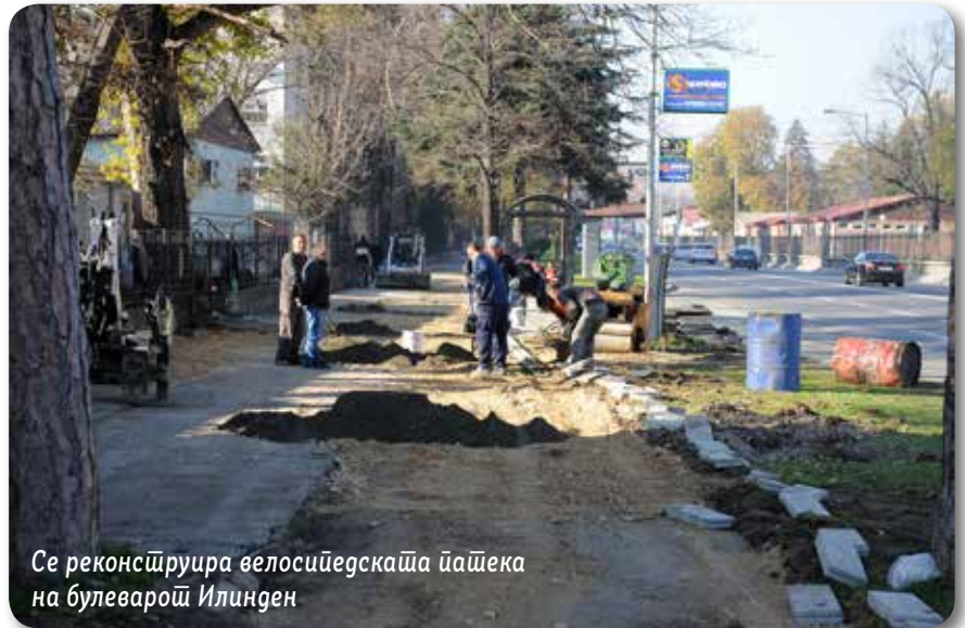
Се реконструира велосипедската патека на булеварот Илинден

Деновите интензивно се работи на реконструкција на постојната пешачка и велосипедска патека по должината на булеварот Илинден, на потегот од крстосницата со улицата Љубљанска до цвеќарницата кај Матично, во должина од 2.300 метри. Стариот и оштетен асфалт е изгребан, патеката е проширена, наместени се нови рабници и се нанесува нов асфалтен слој. За влез и излез од крстосниците се изведуваат рампи за непречено движење. Патеката ќе биде