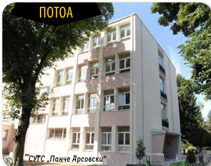
СУГС „Панче Арсовски“