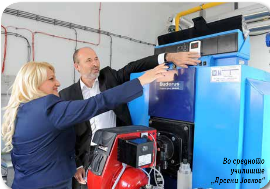
Во средното училиште „Арсени Јовков“

Со реализацијата на овој проект Градот Скопје директно придонесува за почиста и поздрава животна средина и за подобар квалитет на амбиентниот воздух во градот.