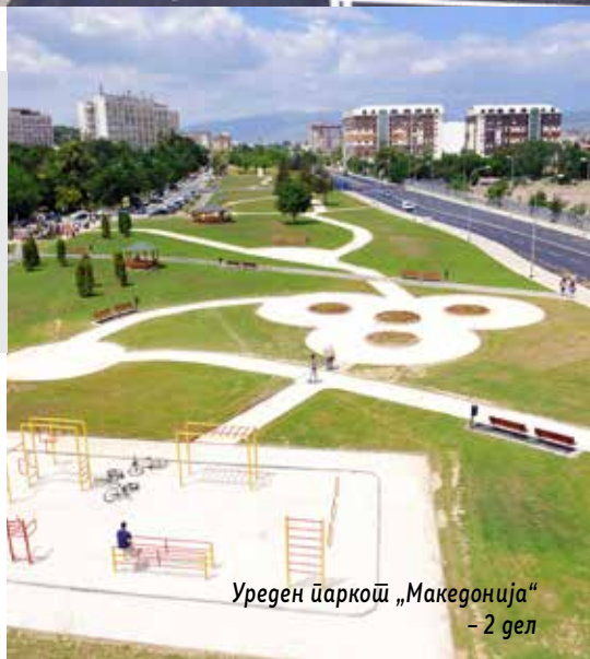
Уреден парк „Македонија“ – 2 дел