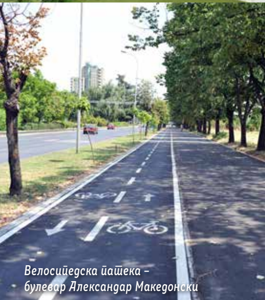
Велосипедска пашека – булевар Александар Македонски