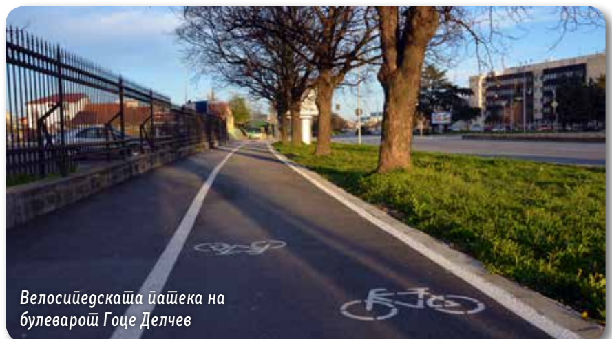
Велосипедската патека на булеварот Гоце Делчев