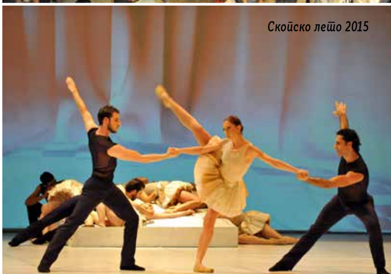
Скојско лејшо 2015