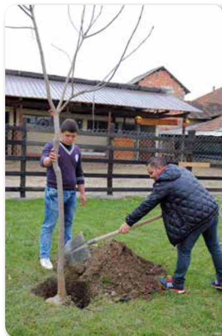
Во дворој на СУГС „Браќа Миладиновци“