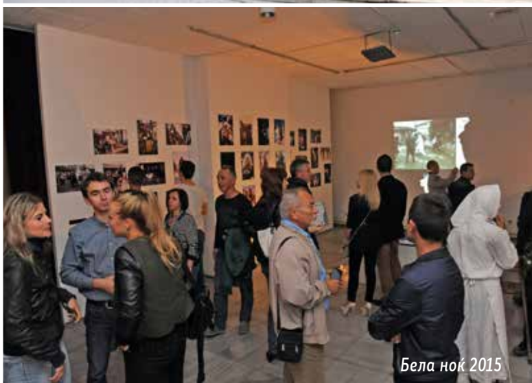
Бела нок 2015