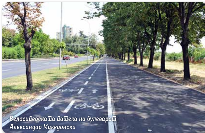
Велосипедската патека на булеварот Александар Македонски