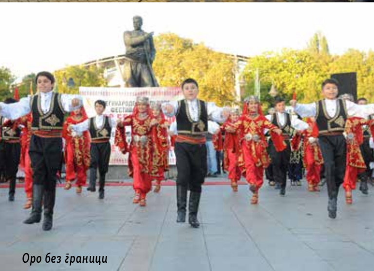
Оро без жраници