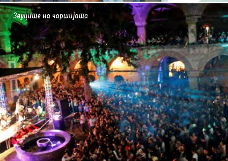
Звуцише на чаршијата