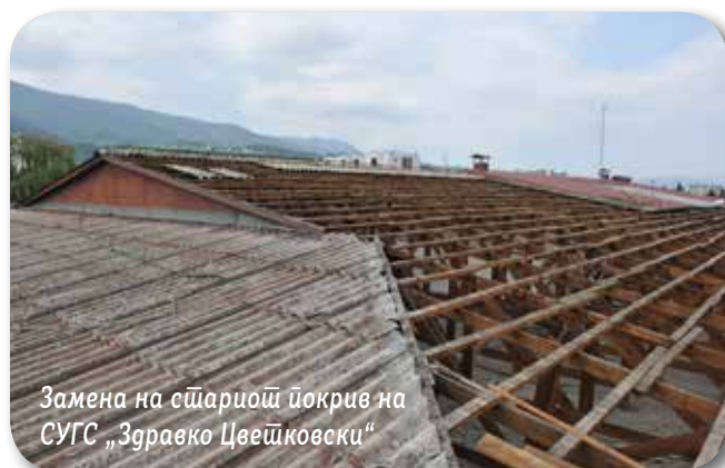
Замена на стариот покрив на СУГС „Здравко Цветковски“