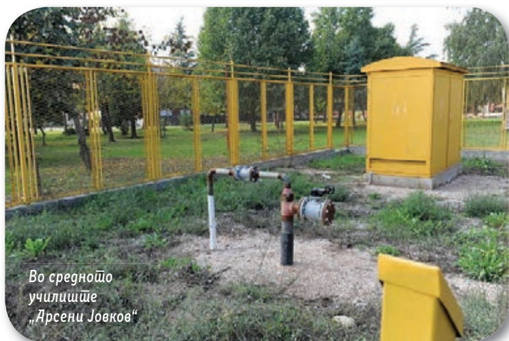
Во средното училиште „Арсени Јовков“