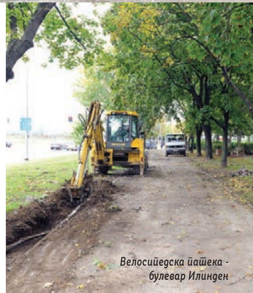
Велосийедска пашека - булевар Илинден