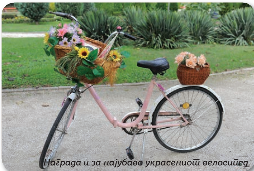
Награда и за најубаво украсениот велосипед