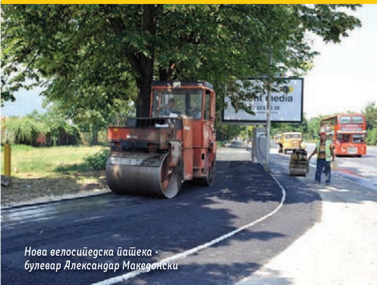
Нова велосийедска пашека - булевар Александар Македонски