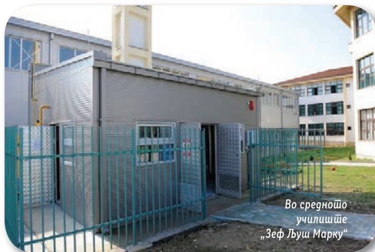
Во средното училиште „Зеф Лјуш Марку“