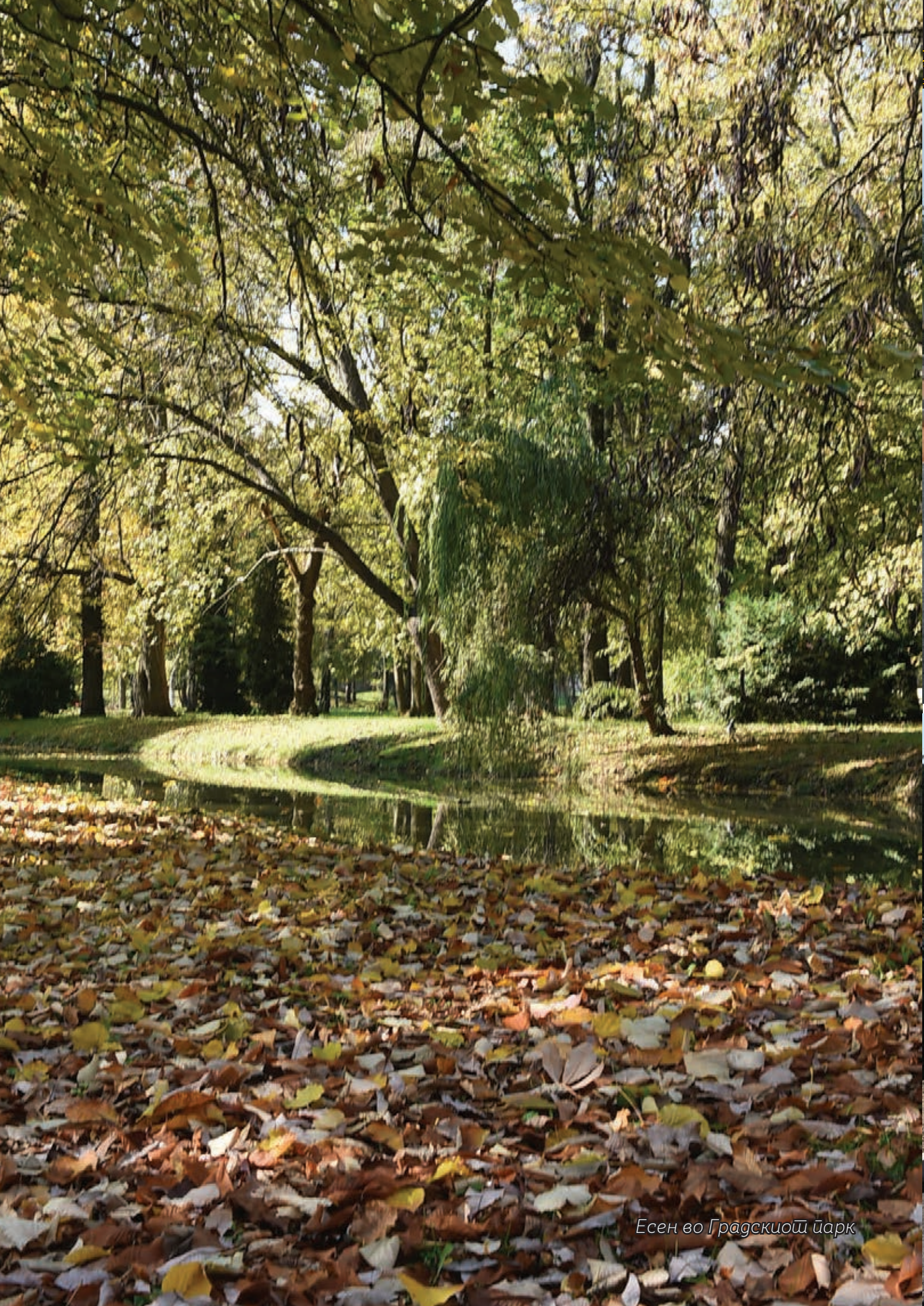
Есен во Градскиот Парк