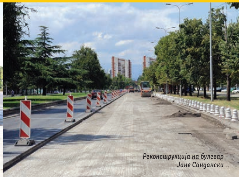
Реконструкција на булевар Јане Сандански