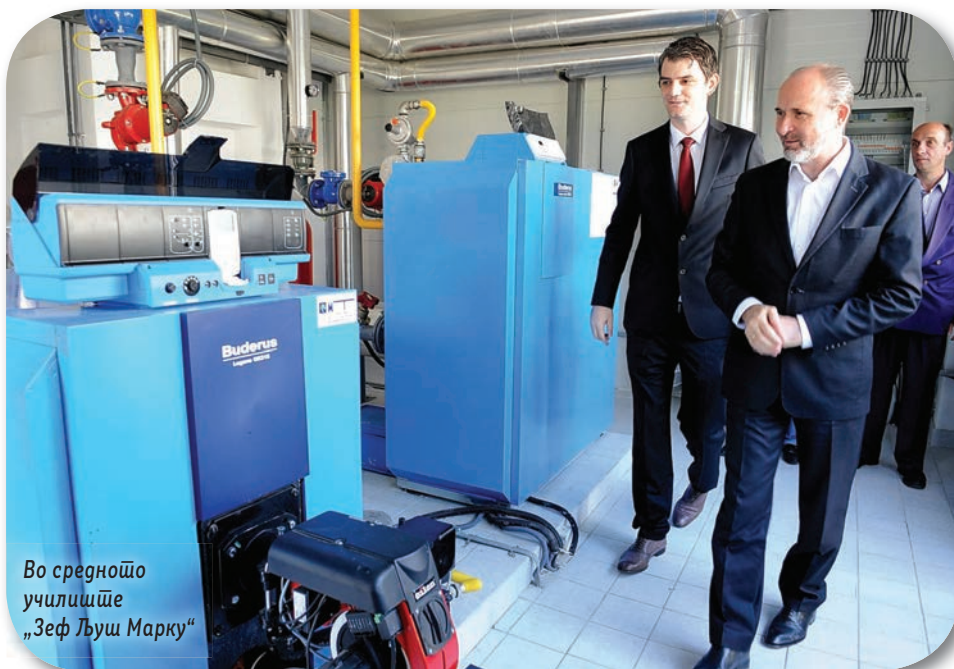
Во средното училиште „Зеф Љуш Марку“

Со реализацијата на овој проект Градот Скопје директно придонесува за почиста и поздрава животна средина и за