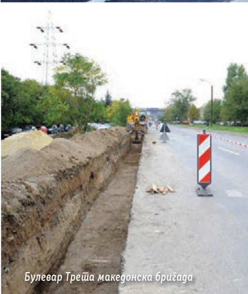
Булевар Треша македонска бригада