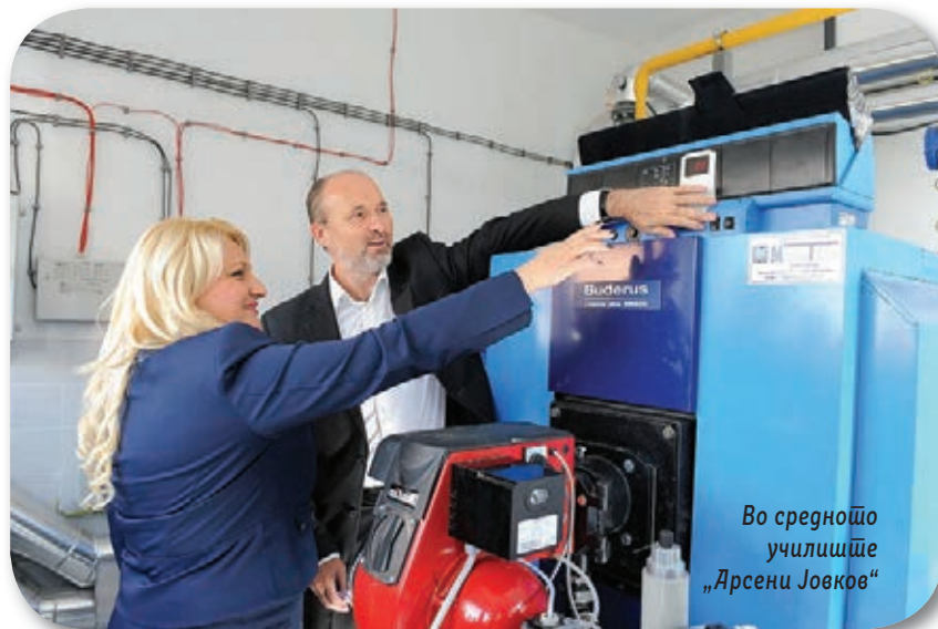
Во средното училиште „Арсени Јовков“

- На почетокот на грејната сезона ги пуштаме во употреба котлите на гас во СУГС „Арсени Јовков“, каде што учат околу 2. 000 ученици. Гасификацијата на ова училиште е дел од проектот за гасификација на две училишта – СУГС „Арсени Јовков“ и „Зеф Лјуш Марку“, во вредност од 15 милиони денари. Според пресметките, се очекува да се заштеди околу 50 проценти од финансиските средства кои претходно се трошеа за греене и повраток на инвестицијата за околу четири години. Досега, гасификација е спроведена во