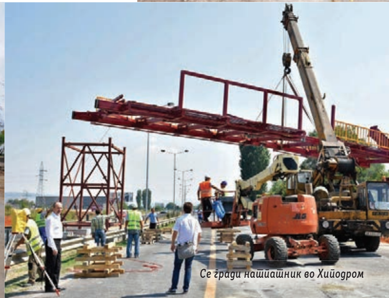
Се зради нашиа шик во Хиодром