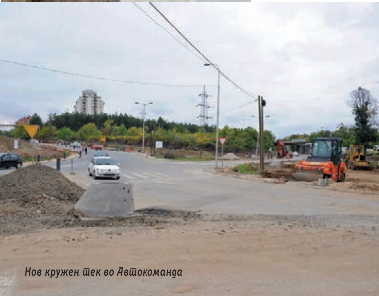
Нов кружен шек во Дешокоманда