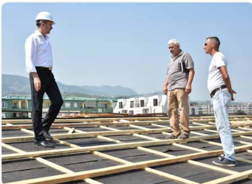
Замена на стариот азбестен покрив на СУГС „Здравко Цветковски“

Од 21 средно училиште на Град Скопје, 9 училишта беа покриени со азбестно-цементни материјали. По извршените опсежни анализи и подготовки, во 2011 година Градот Скопје ги замени абестните покриви на СУГС „Георги Димитров“, СУГС „Раде Јовчевски Корчагин и на СУГС Арсени Јовков. Во 2012 година се работеше на покривот во СУГС „Владо Тасевски“ и во СУГС „8. Септември, а во 2013 година покривот беше сменет во СУГС „Јосип Броз Тито“ и во СУГС „Цветан Димов“. Во текот на летниот распуст во 2014 година, стариот азбестен покрив беше заменет во СУГС „Михајло Пупин“ и во Интернатот „Здравко Цветковски“, а ова лето се интервенираше и во СУГС „Здравко Цветковски“.