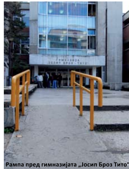
Рампа пред гимназијата „Јосип Броз Тито“