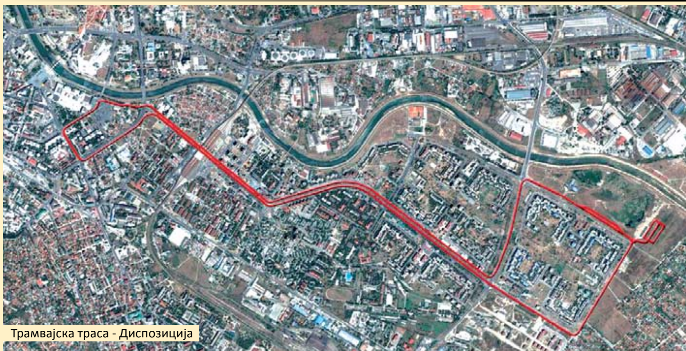
Трамвајска траса - Диспозиција