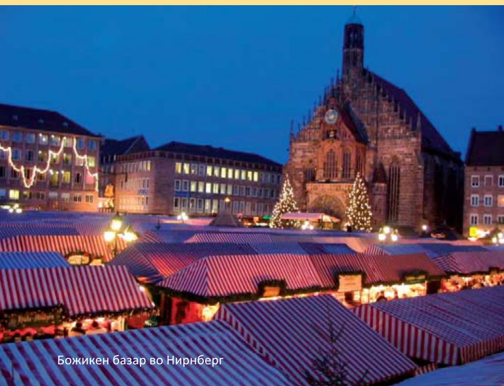
Божиќен базар во Нирнберг