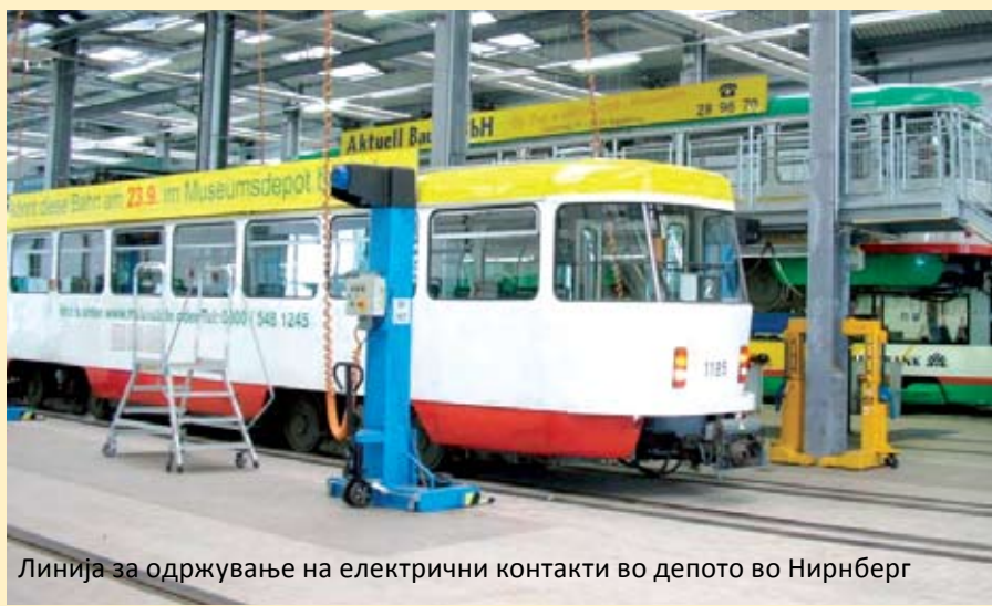
Линија за одржување на електрични контакти во депото во Нирнберг

Третата траса ќе ги поврзува населбата Кисела Вода со булевар „Босна и Херцеговина“ во Бутел, а четвртата ќе се движи по булеварот „Партизански одреди“ и ќе стигне до населбата Ченто.