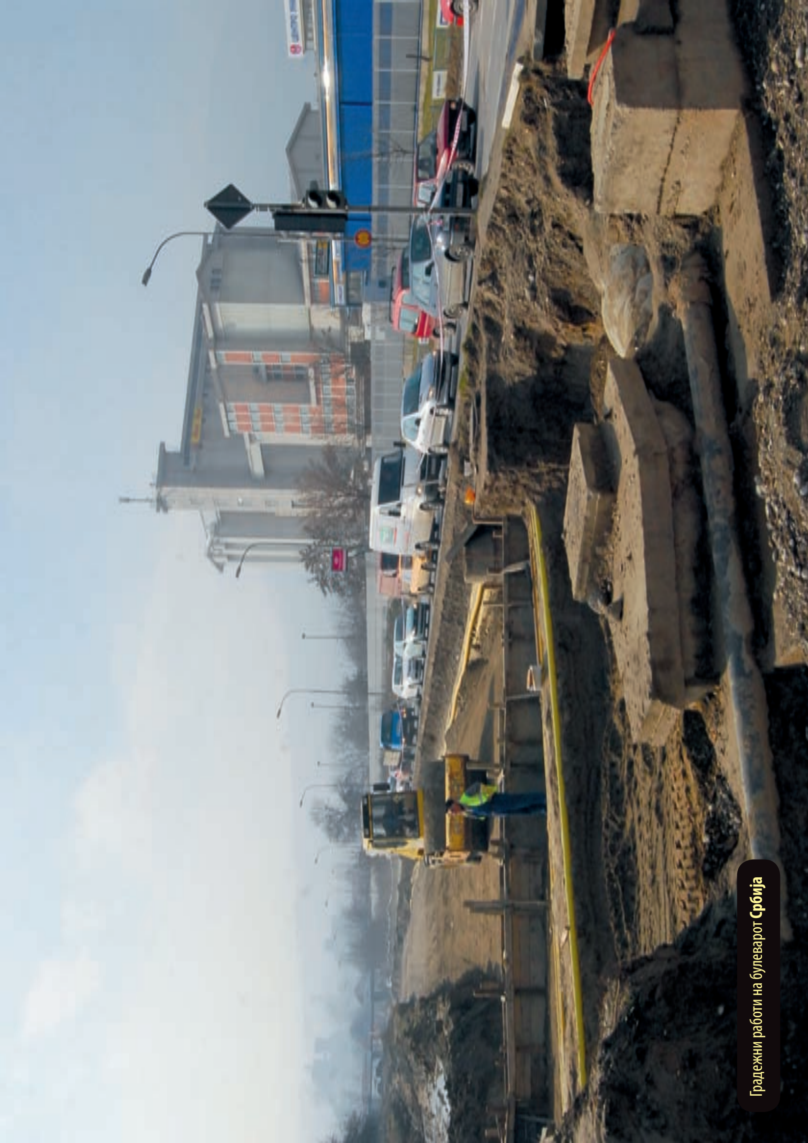
Градежни работи на булеварот Србија