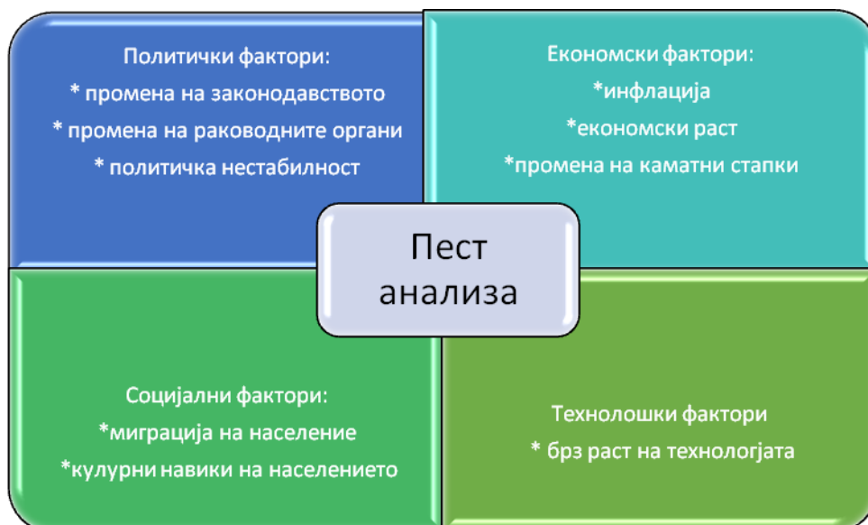
Табела бр.2 – ПЕСТ (PEST) Анализа

PEST анализата се однесува на надворешните фактори како што се: политичките, економските, социо-културните и технолошките. При подготовка на стратешка анализа или истражување на пазарот е битно да се земат предвид овие фактори, бидејќи влијаат на целокупното работење и функционирање на сите сектори во Градот Скопје.