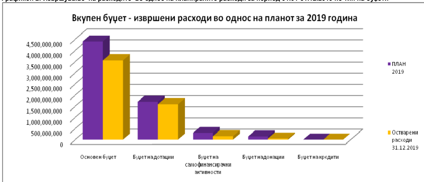
Графикон 2: Извршување на расходите во однос на планираните расходи за период 01.01-31.12.2019 по тип на буџети

Во продолжение се прикажани податоците за извршување на буџетот на Град Скопје за периодот 01.01 – 31.12.2019 година, по поединечни буџети од кои е составен (основен буџет, буџет на дотации, буџет на самофинансирачки активности, буџет на донации и буџет на кредити).