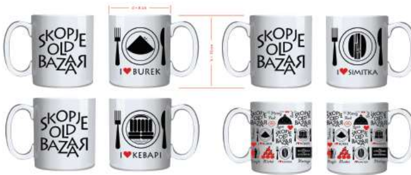
ПОРЦЕЛАНСКИ ЧАШИ ВО РАЗМЕР 1.1, ПРЕДНА И ЗАДНА СТРАНА

идејно решение на визуелен идентитет за сувенири