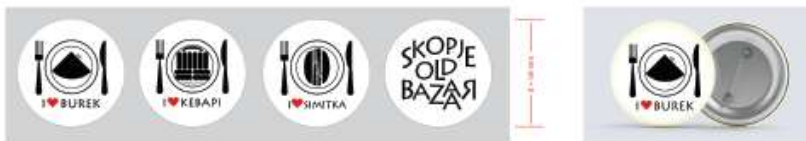
МЕТАЛНИ БЕЏЕВИ ВО РАЗМЕР 1.1