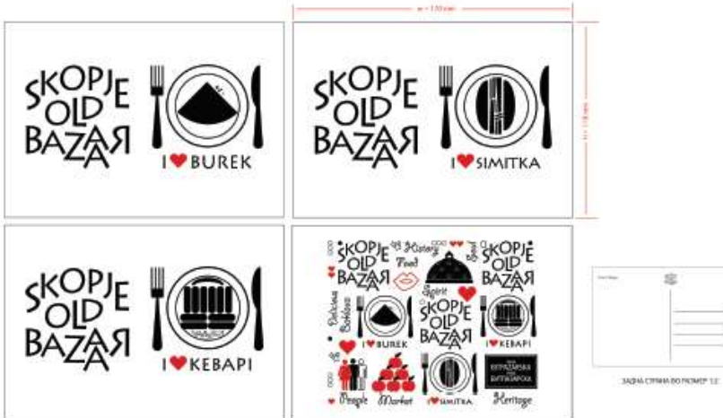
РАЗГЛЕДНИЦИ ВО РАЗМЕР 1.1